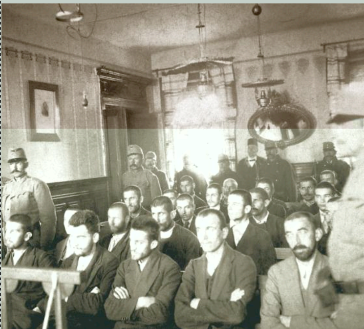
Muzej Sarajevu, Sarajevu u Austro-Ugarskoj 1914-1918