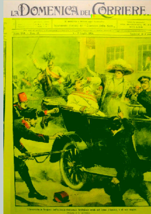
http://previews.agefotostock.com/previewimage/bajaage/510b7d637895591db19d6200dd4aa0f2/DAE-11319783.jpg downloaded on 27 Feb. 2012)

“Katastrofë në Sarajevë. Atentat ndaj arqidukës Franc Ferdinandit dhe dukeshës nga Hohenbergu me bombë dhe “Browing”. Vriten trashëgimtari i frontit dhe gruaja e tij. Dy atentate. (...) Burgosen atentatorët. Kthimi i perandorit.” Die Illustrierte Kronen Zeitung (gazeta më e madhe Austriake, që botohej që nga viti 1900), 29 qershor 1914