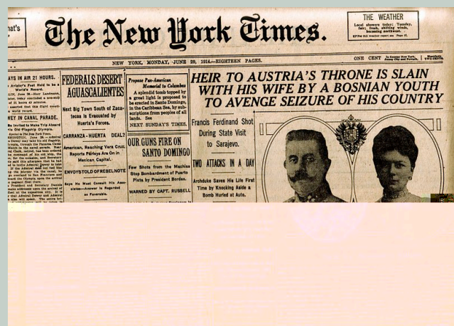
New York Times (American daily paper published continuously since 1851), 29 July 1914, Internet, http://blu.stb.s-msn.com/i/7B/4992F9D19CEEE63507ADD6D4C2BE2.jpg , downloaded on 2 June 2013